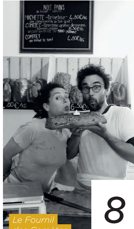
Le Fournil des Comètes